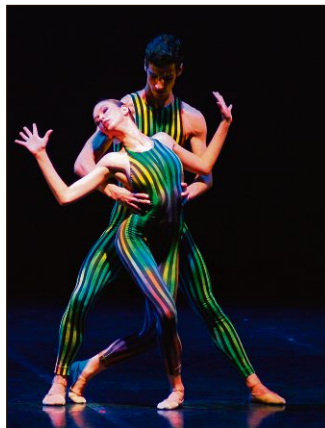
Virtuose Technik auf der Bühne im Velodrom